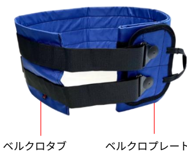
ベルクロタブ ベルクロプレート

新旧の違い:ベルクロタブとベルクロプレートとの接合方法がボタンから縫合へ変更されている。